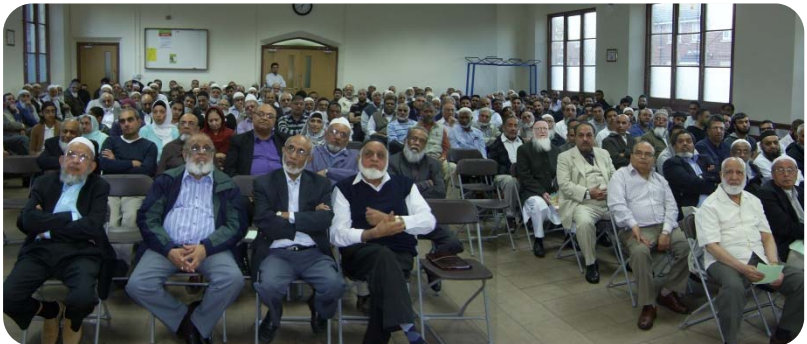
મુશાયરાની મોજ માણી રહેલા ગઝલરસિક શ્રોતાઓ