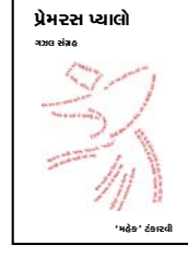
પ્રેમરસ ખાલો ૨૦૧૩

Title: ‘Trupti’ Edition: 2 nd (e-book) Copyright: © 2019 Mahek Tankarvi - All Rights Reserved